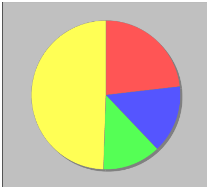
Distribuzione dei docenti a T.I. per anzianità nel ruolo di appartenenza (riferita all'ultimo ruolo)